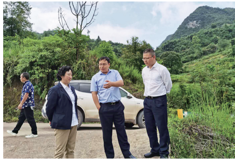
2020年底完成种植10万亩,着力打造“红枫之城”。元宝枫产业不仅是一项绿色生态健康产业,还能促进生态旅游业发展,带动第三产业的发展。下一步,两山农林集团将继续以元宝枫产业为引领,扎实推进农村一二三产融合发展。

自清镇市启动元宝枫项目以来,已获得贵阳农商银行资金支持达7.4亿元。目前,两山农林集团已在清镇市8个乡镇种植元宝枫共计4万余亩,预计