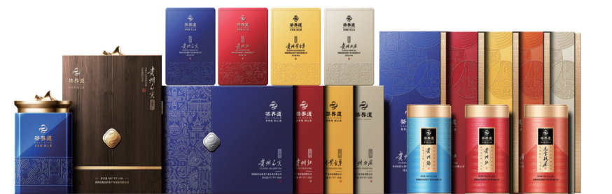
——“茶界道”茶叶品牌包装展示

茶界道，是制茶之道、饮茶之道、赠茶之道。彰显着贵州茶叶的“技艺之道”，传达着中国得体的“礼仪之道”，更是珍贵贵州茶的“价值之道”。