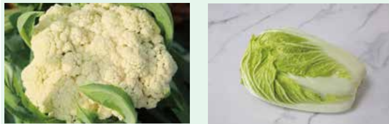
【速顺配送公司部分蔬菜】