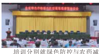
培训分别就绿色防控与农药减量、生态调控技术、害虫天敌昆虫保护利用、昆虫信息素在测报防治中的作用、草地贪夜蛾防治技术等内容对参训人员进行了培训。