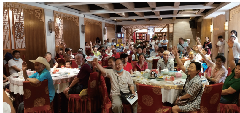
疯狂抢购 好评连连