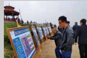
受邀嘉宾通过展板了解项目概况