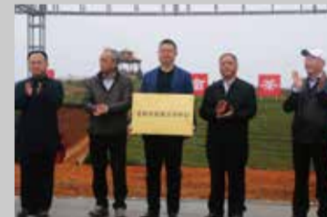
贵州茶资源交易中心落户清镇授牌仪式