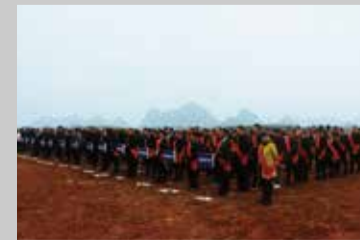
观摩现场整齐的方阵