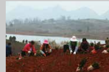
开工仪式并未影响茶农的正常劳作