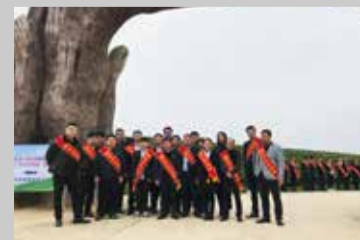
百余民投人以整齐面貌为嘉宾们热忱服务